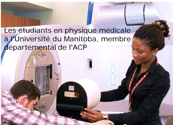
Les étudiants en physique médicale à l'Université du Manitoba, membre départemental de l'ACP