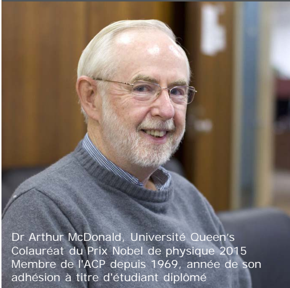
Dr Arthur McDonald, Université Queen's Colauréat du Prix Nobel de physique 2015 Membre de l'ACP depuis 1969, année de son adhésion à titre d'étudiant diplômé